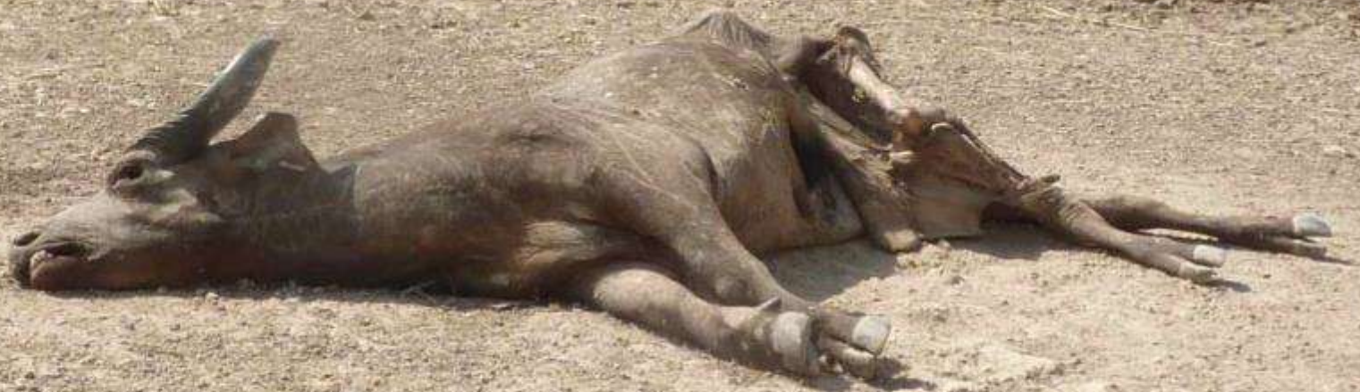
Buffle en mars à la mare Bali