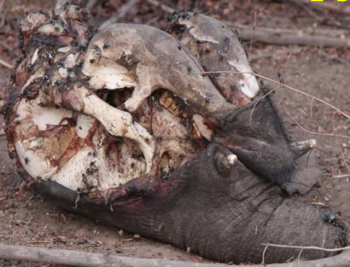
Eléphanteau mort 21.4.2015